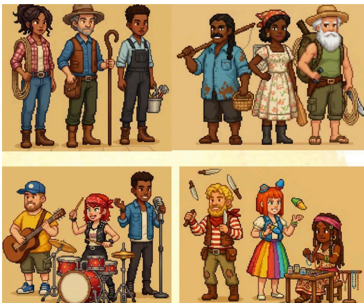
Figura 4 - Classes jogáveis: Estancieiros, Ribeirinhos, Músicos e Artistas de Rua.