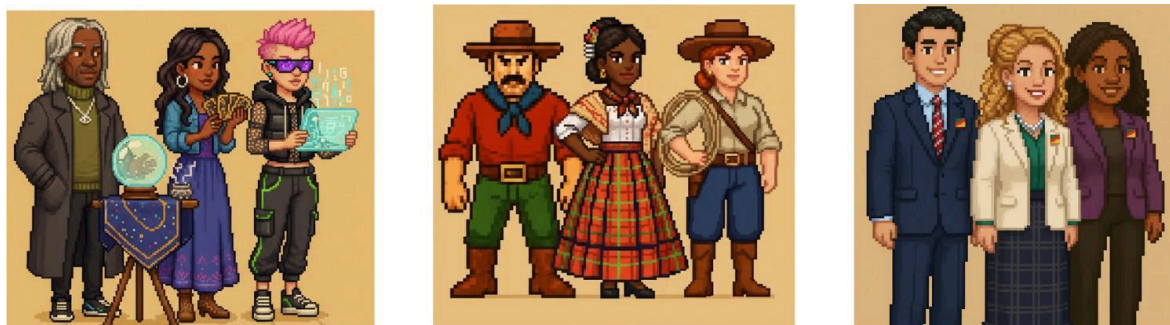
Figura 2 - Classes jogáveis: Videntes de praça, Gaúchos, Políticos.

Guarda de Fronteira - Fluente em português e espanhol, simboliza a importância das relações internacionais em cidades de fronteira.