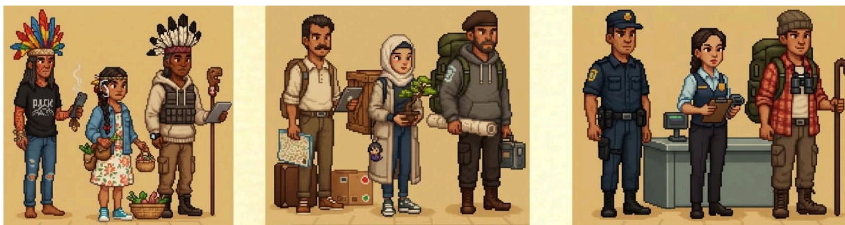
Figura 3 - Classes jogáveis: Indígenas, Imigrantes e Guardas da Fronteira.