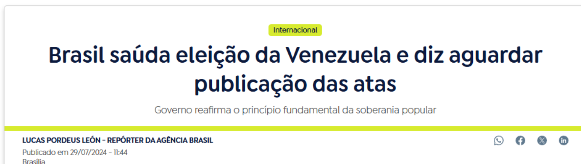
Figura 3 -Publicação da Agência Brasil na semana das eleições venezuelanas

Durante a eleição Venezuela, vários jornais destacavam o papel do Brasil na eleição venezuelana e a importância do Brasil para a realização do pleito. Um deles, o nacional Agência Brasil destaca a importância do Brasil como mediador ao reafirmar o Brasil como fiador do acordo de Barbado. O jornal destaca o Brasil como um dos fiadores do acordo que possibilitou a realização das eleições venezuelanas.