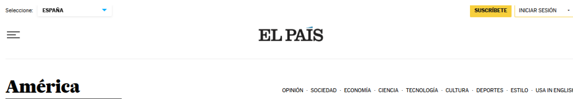
Figura 4 – Publicação do Jornal EL País