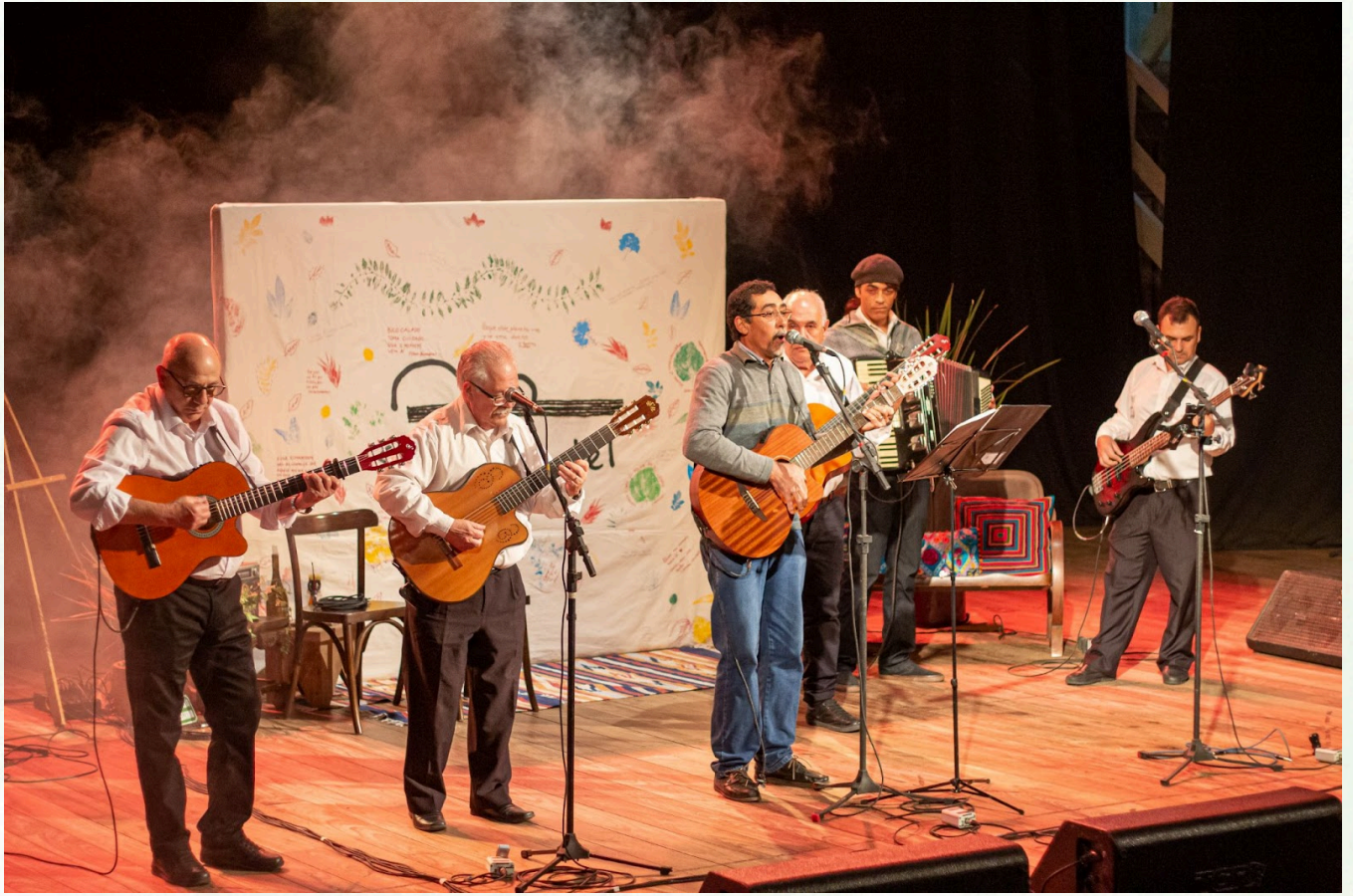
Imagem: Mateus de Souza Teixeira