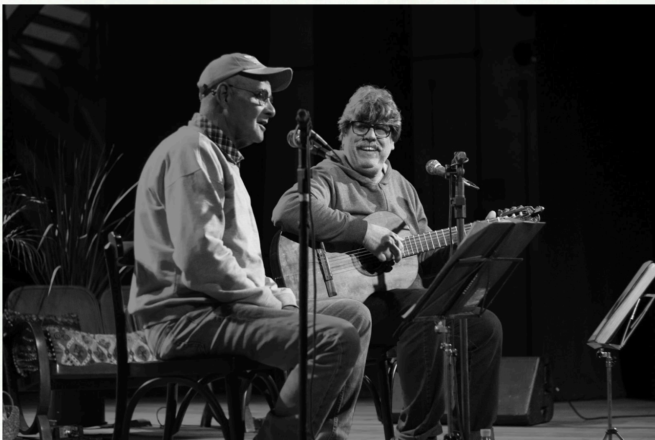
Imagem: Mateus de Souza Teixeira