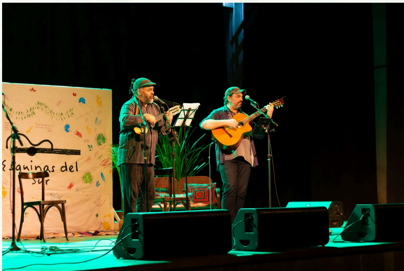
Imagem: Mateus de Souza Teixeira