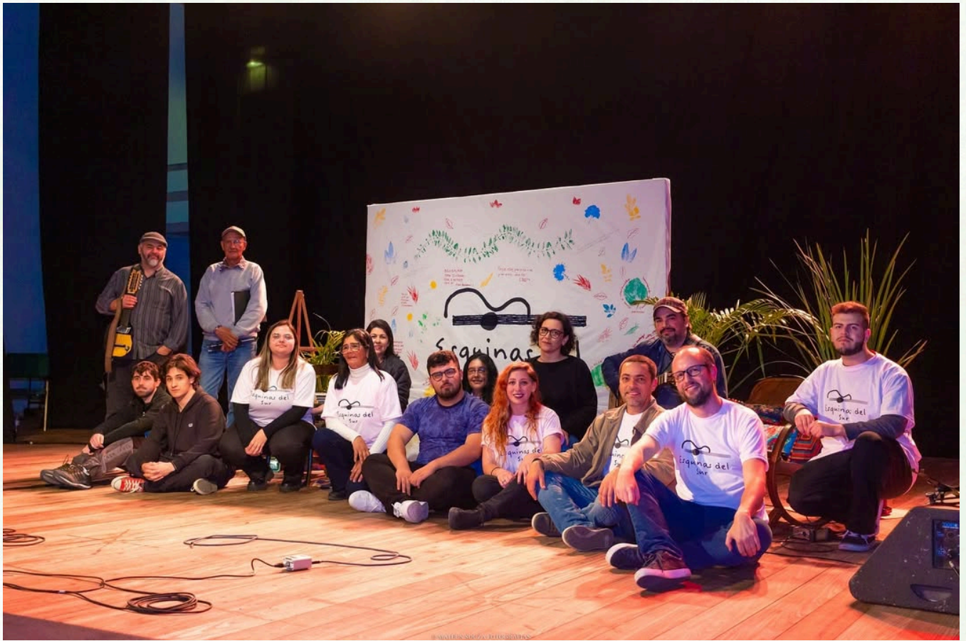
Imagem: Mateus de Souza Teixeira