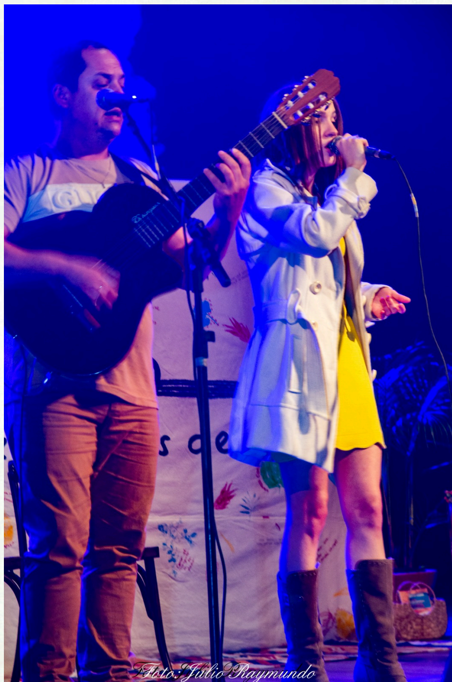
Imagem: Julio Raymundo