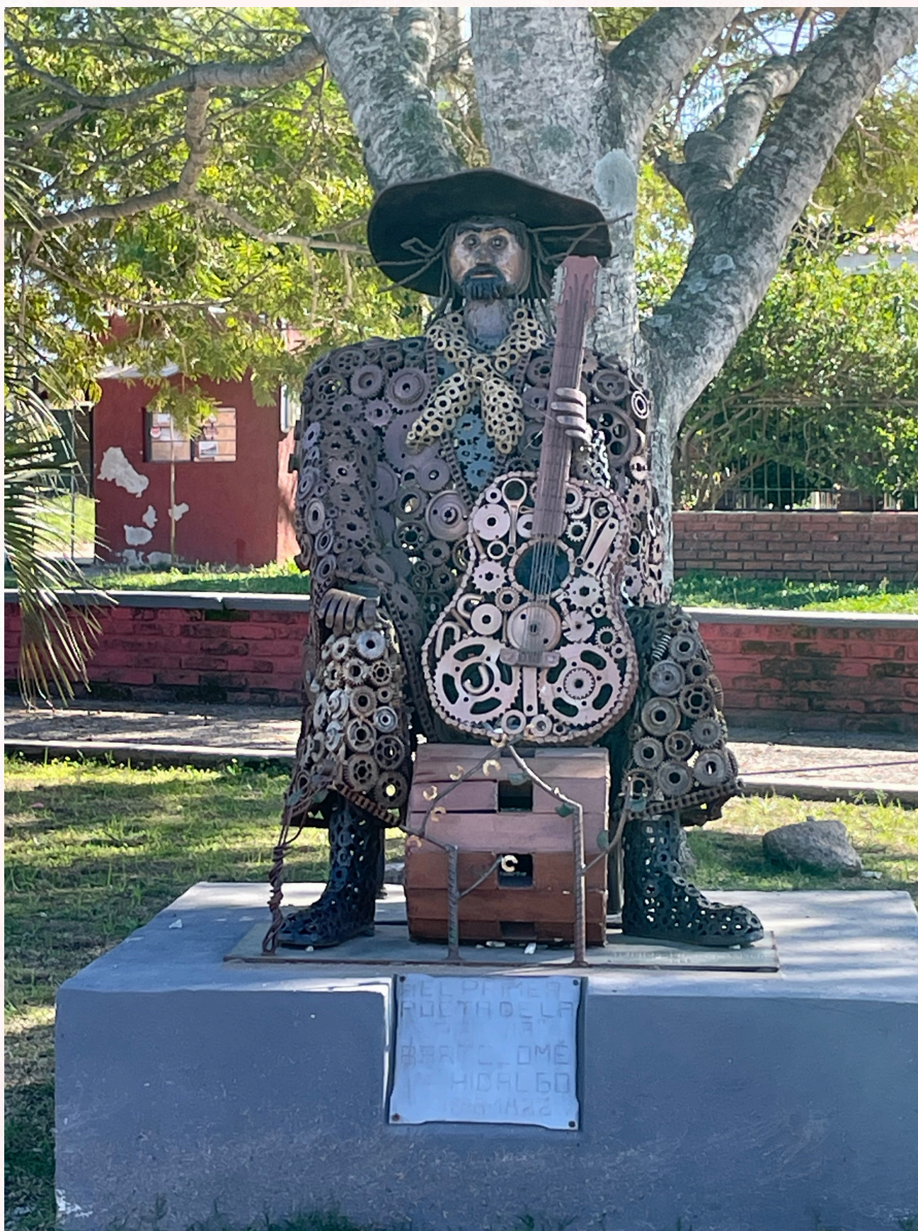
Imagem: Fabiano Severo Bertoncetto

A el primer poeta de la patria - Bartolomé Hidalgo (1788 - 1822) - Juan Carlos Muniz (2023)