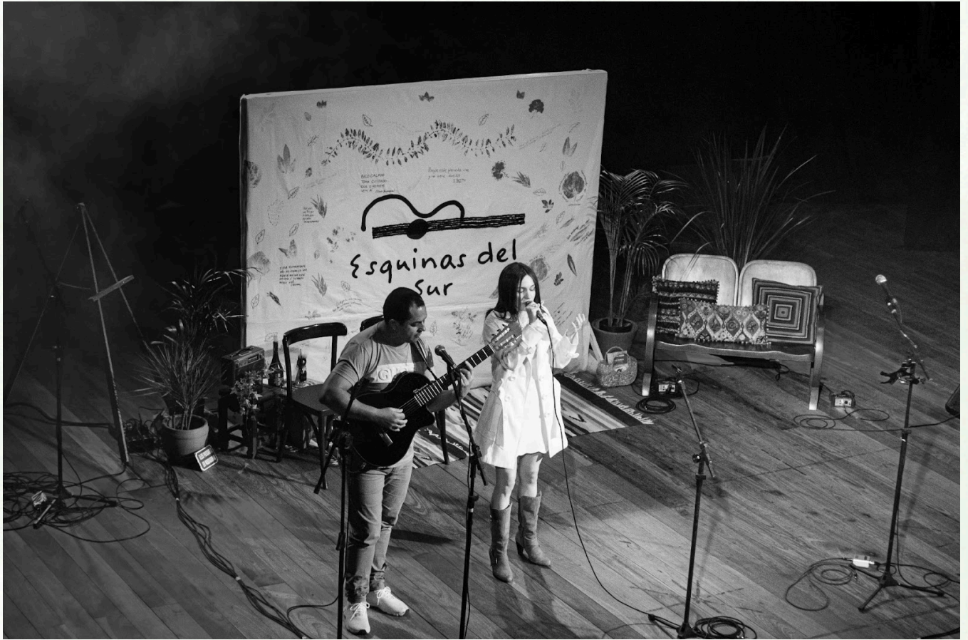
Imagem: Mateus de Souza Teixeira