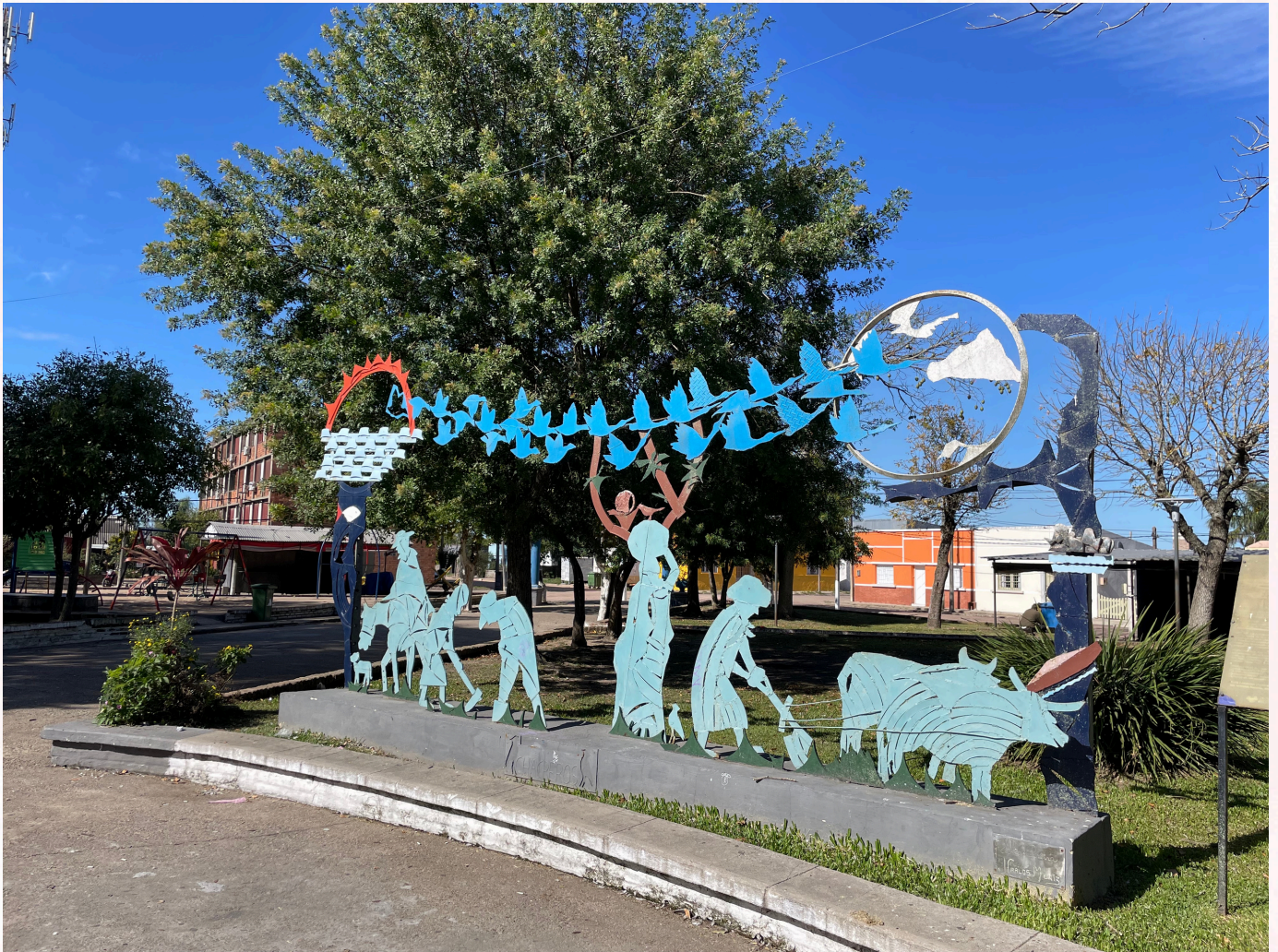
Imagem: Fabiano Severo Bertoncello