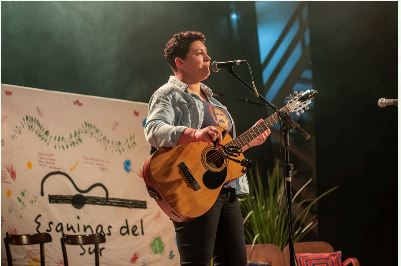
Imagem: Mateus de Souza Teixeira