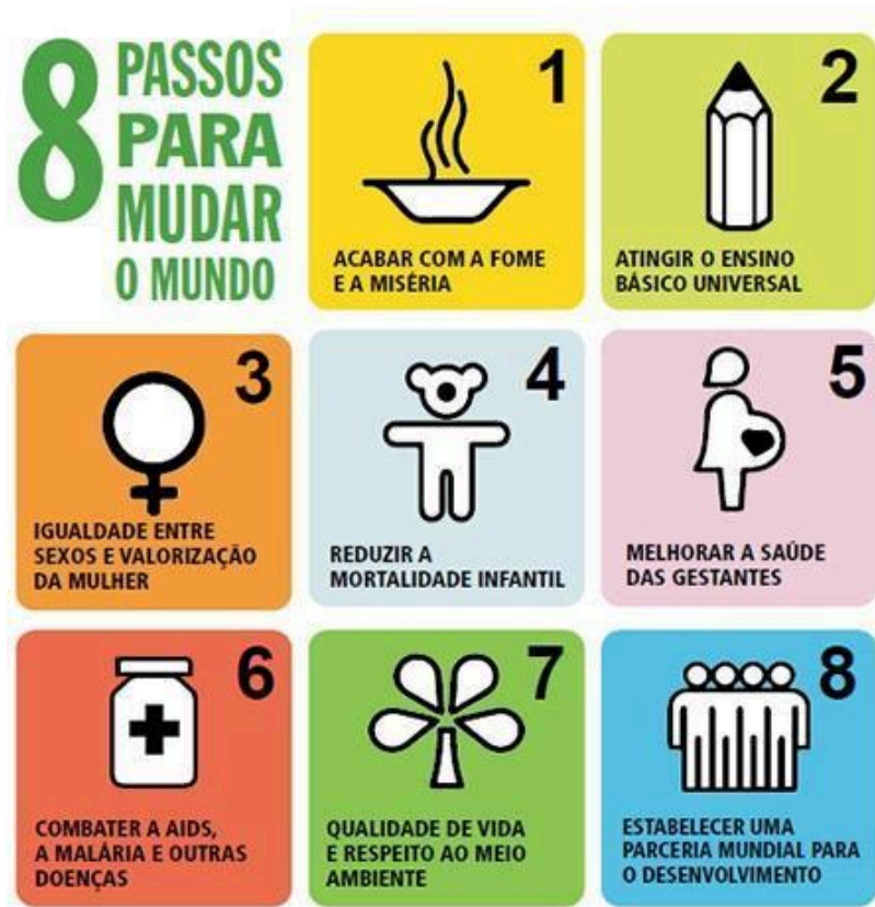
FIGURA 1 - Objetivos do Desenvolvimento do Milênio