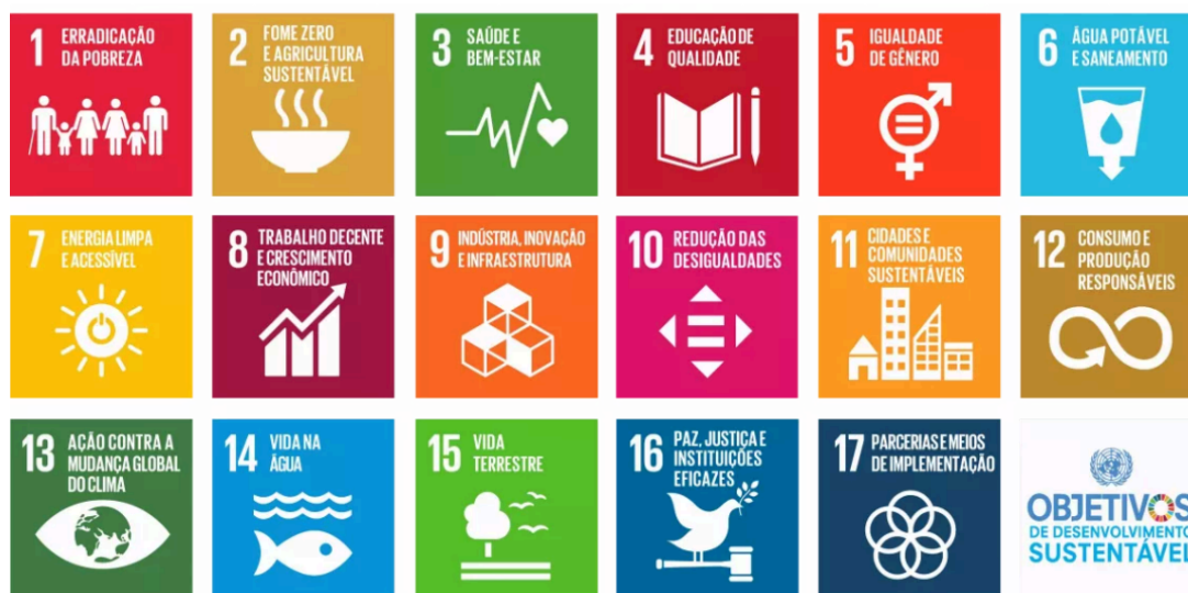
FIGURA 2 - Objetivos de Desenvolvimento Sustentável