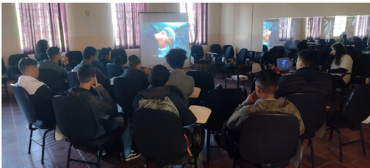
Imagem 1.

Os alunos(as) tinham entre 14 e 17 anos, alguns nos anos finais do ensino fundamental e outros no ensino médio. Através do preenchimento da ficha de inscrição a qual trazia perguntas sobre os conhecimentos prévios deles(as) sobre Rap e Poesia de Rua, os dados mostraram que todos alunos(as) tinham contato com o Rap em sua realidade, incluindo indicação de um Rap em específico para um outro momento de uma nova versão da oficina.