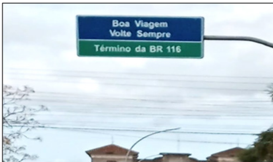
Figura 9 - Placa da BR-116 (Jaguarão - Brasil)

Fonte: Imagem dos próprios autores - Jaguarão-RS, Brasil - 13 abr 2023 - 13:27.