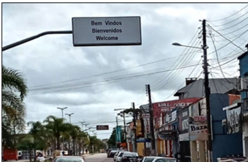
Jaguarão-RS, Brasil - 13 abr 2023 - 13:21.

Por outro lado, também observamos traços de colonialidad na placa da BR-116 ( Figura 7 ), quando opta por incluir o idioma inglês numa placa de sinalização, cuja orientação geográfica está voltada para uma direção que provavelmente receberá turistas vindos do Uruguai e da Argentina, ambos falantes da língua espanhola.