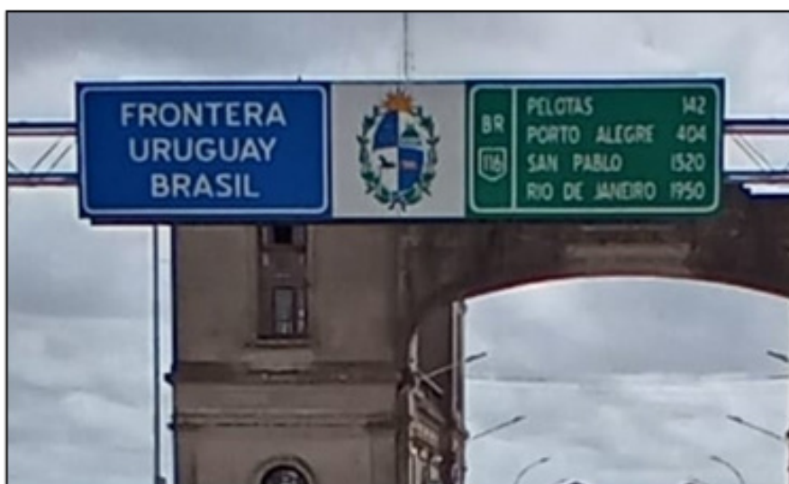
Figura 4 - Placa da BR-116 (Rio Branco - Uruguay)