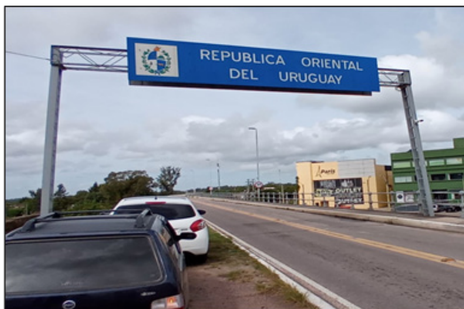
Figura 10 - Verso da Placa da BR-116 (Rio Branco - Uruguay)

Fonte: Imagem dos próprios autores - Rio Branco, Cerro Largo, UY - 13 abr 2023 - 12:32.