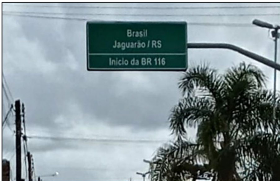
Figura 11 - Placa da BR-116 (Jaguarão - Brasil)