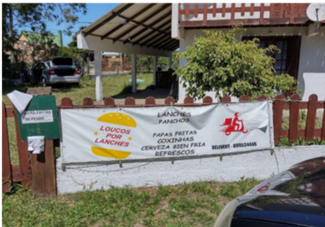
Imagen 1 - Paisaje Lingüístico en Río Branco

Los tres registros presentados a continuación fueron realizados durante los meses de septiembre de 2021 y febrero de 2022 en la zona central de la ciudad de Jaguarão, próxima al Puente Internacional Barão de Mauá, y en las calles de la Laguna Merín, un balneario del Departamento de Cerro Largo, a 20 kilómetros de Río Branco muy frecuentado por brasileños de la región. El perímetro recorrido para la recolección de las imágenes justifica la presencia de anuncios escritos en portugués y español, como veremos abajo.