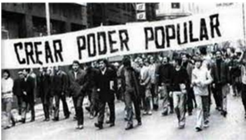
Imagem 2 - Site Democracia Socialista

Allende, em que há “Criar poder popular”, diferente da intervenção linguística encontrada em Jaguarão e da encontrada no discurso de Allende para a rádio. Elas se assemelham aos ideais socialistas e antifascistas, que convocavam o povo para lutar, conforme podemos observar na imagem 2.