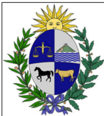
Figura 12 - Escudo de armas del Uruguay

Por último, no verso da placa oficial em análise ( Figura 10 ) percebe-se uma demarcação geográfica através da expressão REPÚBLICA ORIENTAL DEL URUGUAY e uma demarcação administrativa do Estado uruguaio através de seu brasão de armas ( Figura 12 ), cuja descrição consiste, segundo informações contidas no site da embaixada do Uruguai: um escudo oval dividido em quatro quadrantes, tendo no seu topo um sol nascente, o Sol de Mayo , símbolo da nação charrua; o escudo está rodeado por ramos de oliveira à esquerda, representando a paz e por ramos de loureiro à direita, representando a honra; o quadrante superior direito contém o Cerro de Montevideo em fundo prata, representando a força do povo uruguaio; o quadrante superior esquerdo contém uma balança sobre um fundo azul, significando a igualdade e a justiça; na parte inferior direita temos um boi dourado com um fundo azul, significando a abundância; e, por fim, no quadrante inferior esquerdo temos um cavalo sobre um fundo prata, significando a liberdade. (URUGUAY, 2023).