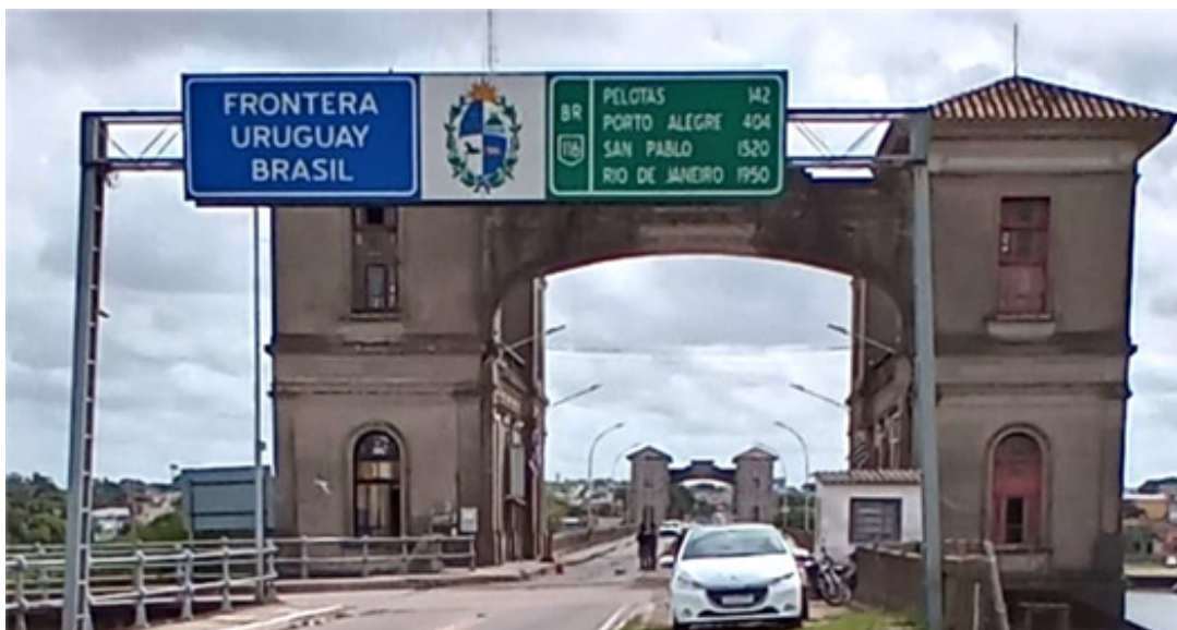
Figura 1 - Placa Oficial da Oficina de Planeamiento y Presupuesto de Municipios - Uruguay

Fonte: Imagem dos próprios autores - Rio Branco, Cerro Largo, UY - 13 abr 2023 - 12:20.