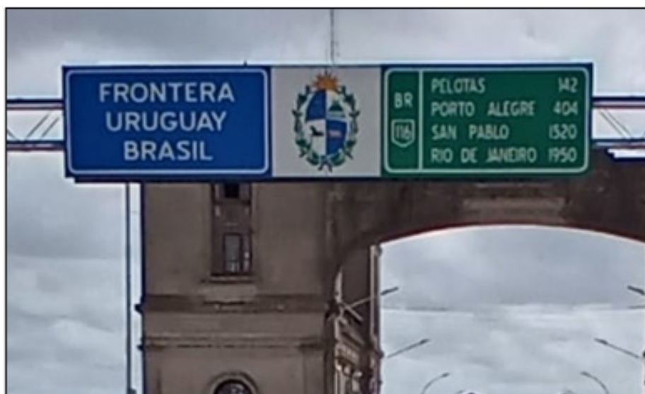
Rio Branco, Cerro Largo, UY - 13 abr 2023 - 12:20.