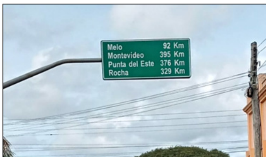
Figura 5 - Placa da BR-116 (Jaguarão - Brasil)

Fonte: Imagem dos próprios autores - Jaguarão-RS, Brasil - 13 abr 2023 - 13:07.