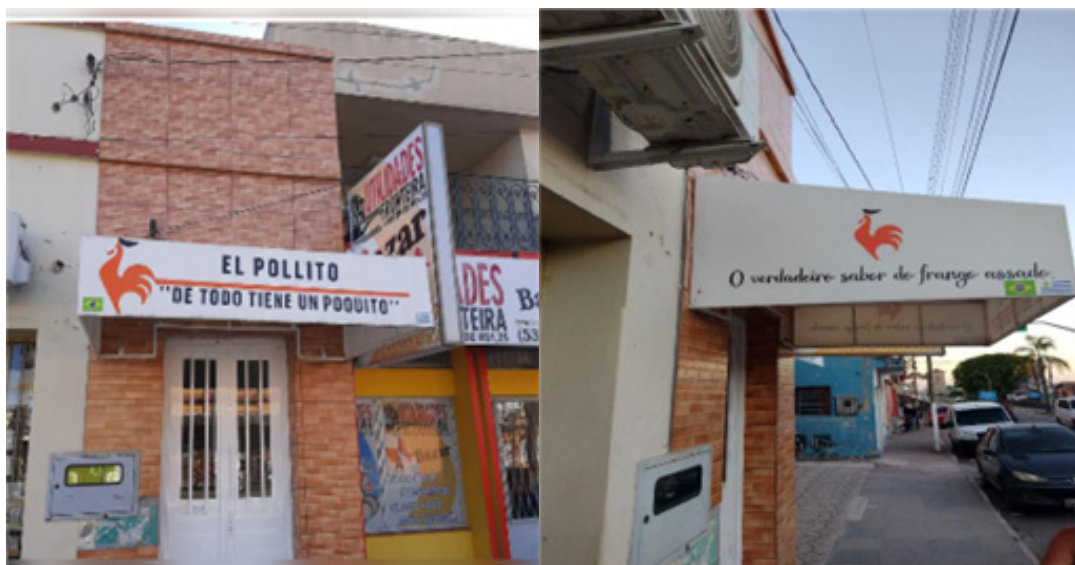
Imagen 2 - Paisaje Lingüístico en Jaguarão

“pollito”, en la forma de diminutivo, y abajo la oración “de todo tiene un poquito”.