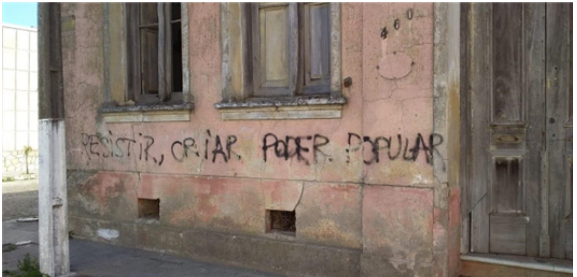
Imagem 1

Comprender esta intervenção a partir da paisagem lingüística requer que a entendamos com base na reflexão já mencionada por Cenoz e Gorter (2004) refletida a partir de Landry e Bourhis (1997, p.25) do modo que para eles "el paisaje lingüístico de un territorio, región o ciudad está constituido por la combinación de la lengua utilizada en anuncios y rótulos comerciales, rótulos de calles y carreteras, rótulos de edificios públicos y otros textos escritos en vías públicas". Nisso, podemos entender que a nossa intervenção fronteiriça "Resistir, criar, poder popular" pode ser compreendida a partir da perspectiva da paisagem lingüística, por ela tratar-se de uma manifestação espontânea de um texto em via pública, posto que o seu surgimento foi de maneira orgânica e espontânea.