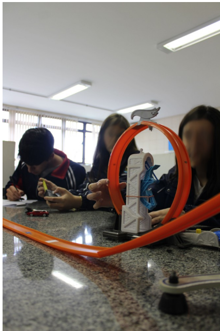
Figura 4 – Etapa de familiarização

conseguiram montar as pistas de percurso em poucos minutos, não apresentando dificuldades para desempenhar esta tarefa.