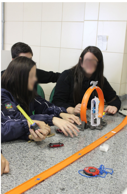
Figura 5 – Etapa de Familiarização