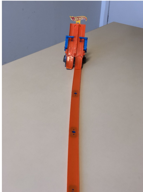
Figura 3 – Pista com rampa.