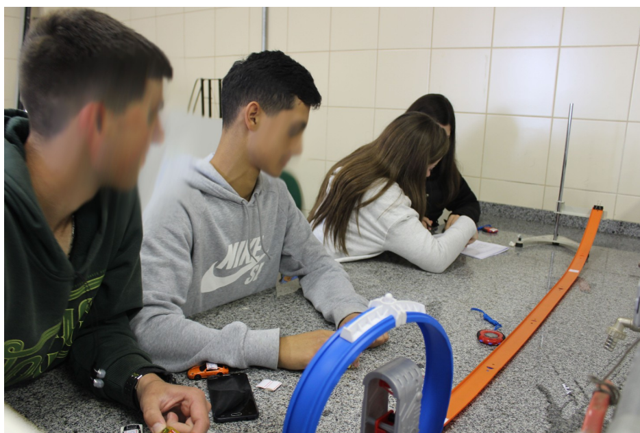
Figura 7 – Explorando a pista com a rampa

Devido a uma dificuldade técnica, não foi possível utilizarmos o software Audacity. Com isso, tivemos que reduzir o questionário, considerando apenas as questões: 3a, 5 e 6. A tabela 4 do roteiro foi readaptada para que os grupos pudessem comparar informações relevantes dos experimentos anteriores e responderem as duas últimas questões (5 e 6). Também, em função da limitação do tempo previsto para terminar as atividades, cada grupo trabalhou apenas com um único carrinho.