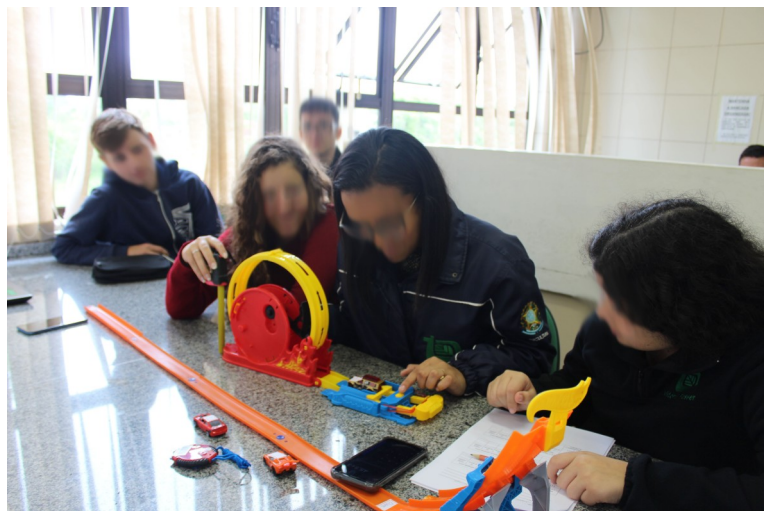
Figura 6 – Explorando o Looping

A segunda etapa , consistiu na ideia de explorar a pista com o looping e com o lançador. Fazendo uso do lançador, que possui três níveis de intensidade, o aluno pode avaliar a diferença ao utilizar cada nível. Antes de iniciarem os testes com as pistas, pedimos que eles formassem uma hipótese: Relacionar o peso (massa) com a altura máxima atingida.