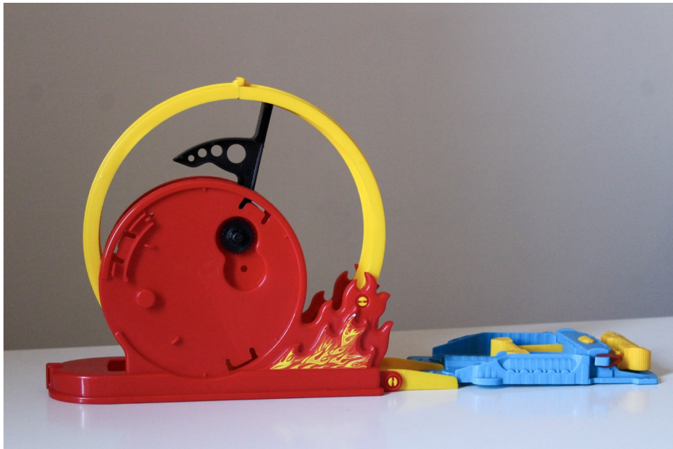
Figura 1 - Lançador e Looping