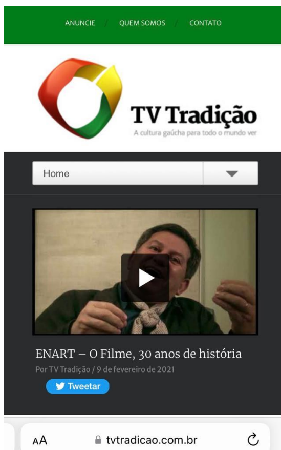
Imagem 4: Print do site da TV Tradição