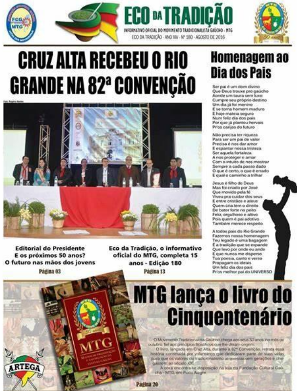
Imagem 2: print da capa de exemplar do jornal Eco da Tradição