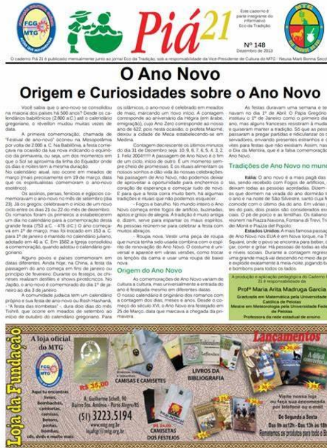
Imagem 3: print de um exemplar do caderno Piá