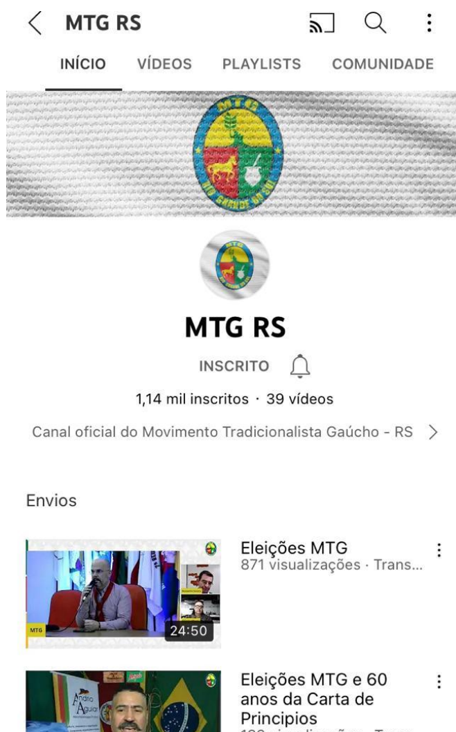
Imagem 9: print do canal do YouTube do MTG

O canal do Youtube foi criado no ano de 2020 mas ainda é pouco utilizado. Atualmente conta com cerca de 1400 inscritos e 39 vídeos publicados. Os conteúdos publicados em sua maioria são lives de eventos que aconteceram de forma online. Foi criado durante a pandemia com o intuito de divulgar e promover eventos de forma virtual. Segundo comenta o assessor de Imprensa no MTG, Rogério Bastos (2022), o canal do youtube não está sendo mais utilizado.