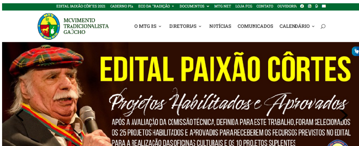
Imagem 1: print do site do MTG