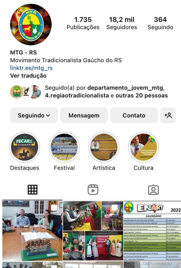
Imagem 7: print do perfil do instagram do MTG

No geral, as publicações são fotografias dos eventos que aconteceram e para a divulgação dos eventos que vão acontecer. Não existe nenhum conteúdo explicativo ao público que não integra o Movimento Tradicionalista Gaúcho. Portanto, os leigos, aqueles que não são atuantes no Movimento, dificilmente entenderão qual a finalidade da página. Além do perfil oficial do MTG, existem outros administrados pelo departamento cultural através das prendas do RS e também perfis de simpatizantes do Movimento, que buscam dar visibilidade aos eventos e ações desenvolvidas pelo Movimento Tradicionalista Gaúcho. Podemos citar o perfil do Cantinho Gaúcho, o perfil do Departamento Jovem do MTG, Prendas e Peões do RS, além dos perfis do MTG em outros estados, como em Santa Catarina e no Mato Grosso.