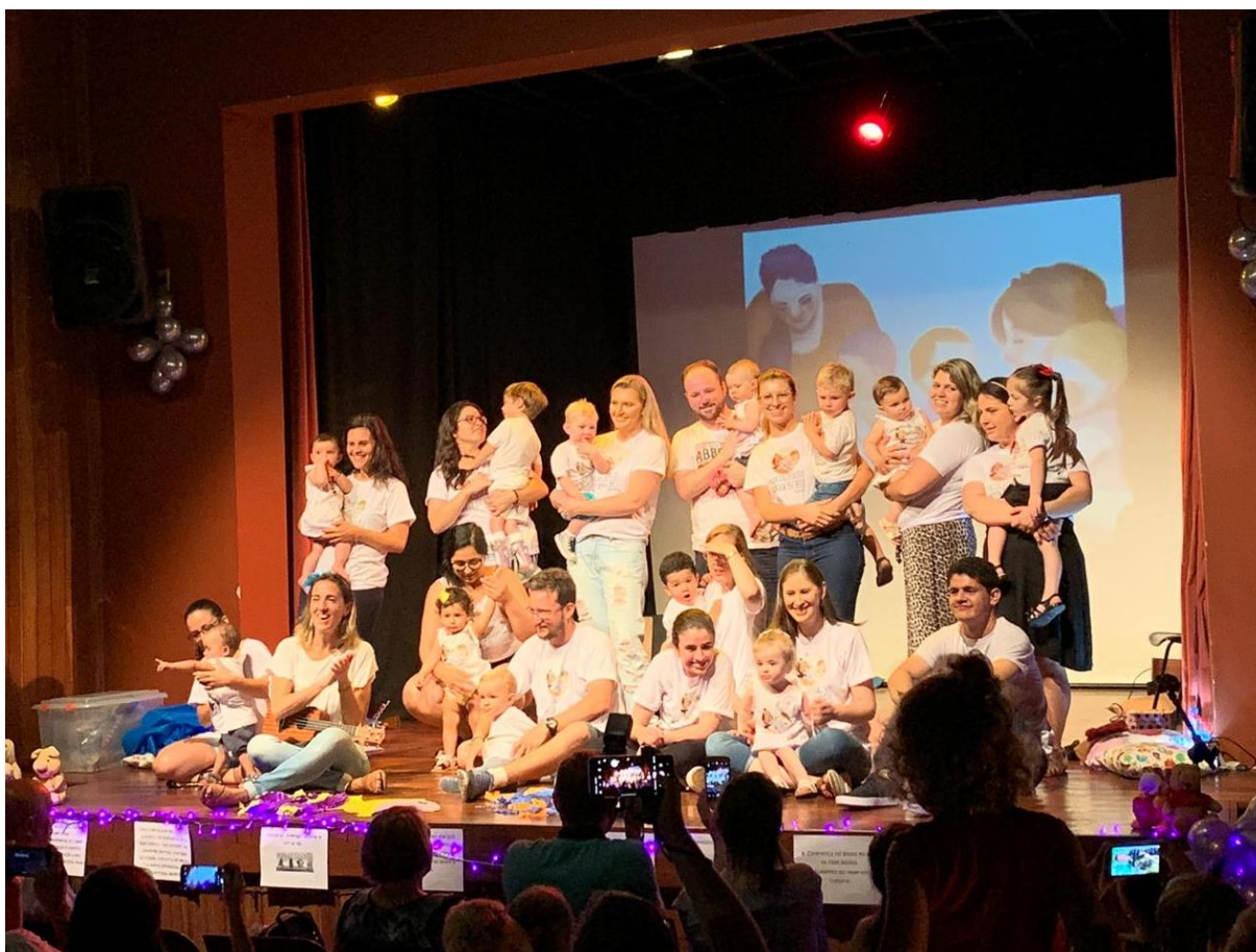
Figura 1 - Apresentação de final de ano das turmas do Projeto de Extensão Musicalização para bebês da Unipampa. Dezembro/2018.

Para estabelecer o diálogo e manter o contato com as famílias, foi criado um grupo num aplicativo de mensagens 2 através do qual recebemos fotos, vídeos e áudios das crianças da musicalização e isso, indiretamente, colabora com o intercâmbio de experiências, trocas e relatos entre as famílias envolvidas no projeto, o que fornece dados significativos para o desenvolvimento da presente pesquisa.