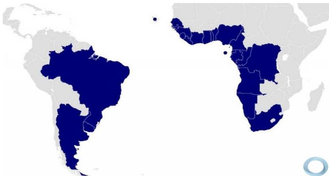
Figura 1 - Mapa da área de influência da ZOPACAS(2013).