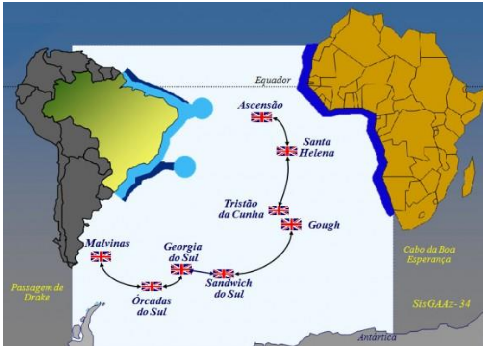
Figura 4 - As ilhas britânicas no Atlântico Sul