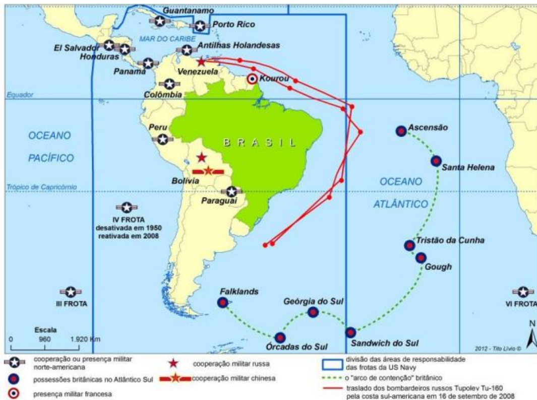
Figura 5 -- Presenças extrarregionais na América do Sul e no Atlântico Sul