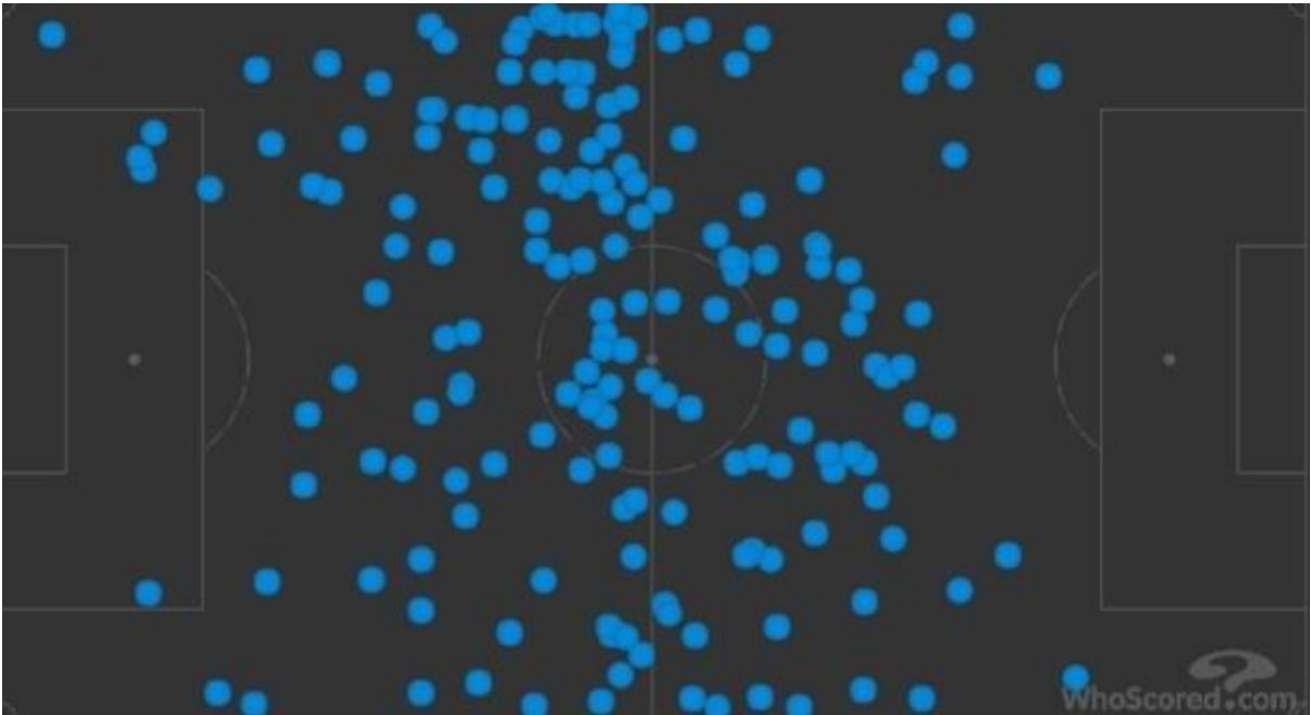
FIGURA 4: Mapa de toque de bola do Grêmio com Maicon, Ramiro e Michel contra o São Paulo, mostrando ocupação de espaço, no Campeonato Brasileiro de 2017