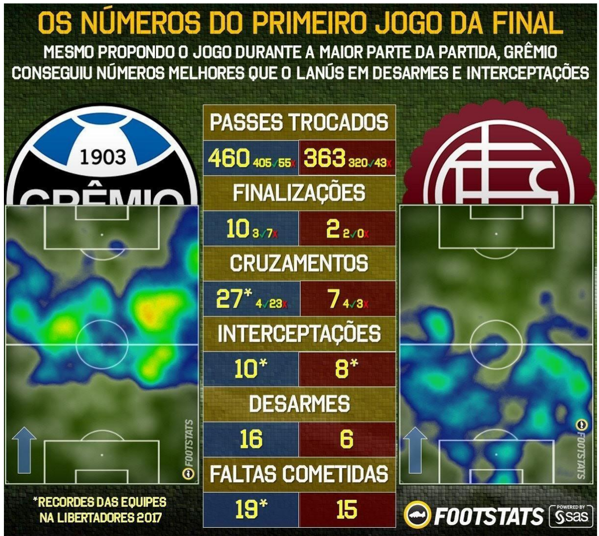
Figura 2 - Estatísticas detalhadas das campanhas de Grêmio e Club Atlético Lanús na Copa Libertadores da América de 2017

b. Footstats: Indica estatísticas detalhadas da partida, especialmente relativas ao que foge da percepção do comentarista, como dados e ranqueamentos de um time e detalhes individuais dos atletas, conforme indica a figura 2.