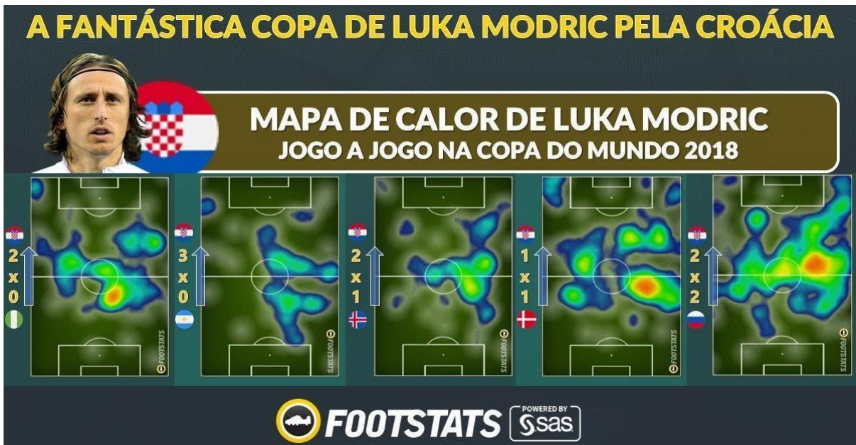
FIGURA 3: Mapa de calor do jogador Luka Modric do Real Madrid e da Seleção da Croácia, desempenho do atleta na Copa do Mundo da Fifa de 2018.