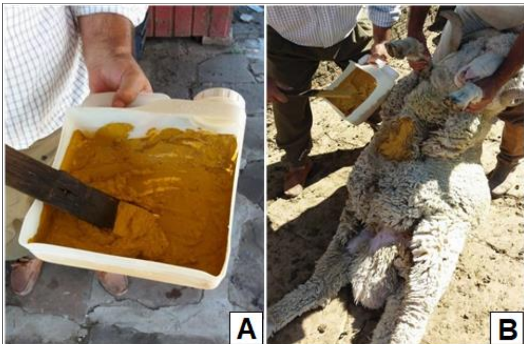
Figura 1 - Mistura da tinta com a graxa (A) e aplicação da tinta no peito do rufião (B)

A técnica reprodutiva de IA via cervical superficial é comumente utilizada no rebanho geral. Os lotes foram formados de acordo com as ovelhas identificadas em estro pelos rufiões. Para identificar as ovelhas no estro foi utilizada uma tinta formulada com pó xadrez e graxa, para os lotes 1 e 2 se utilizou-se a cor amarela, a cada 15 dias trocava-se a cor da tinta. A aplicação da tinta está representada na Figura 1.