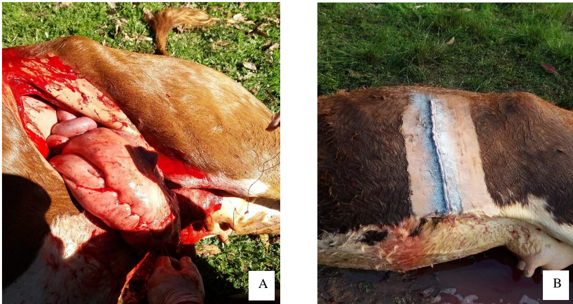
Figura 8 - Sutura de útero (A) e sutura de pele em cirurgia de cesariana (B).

finalizada eram introduzidos no útero dois tabletes efervescentes de gentamicina (GINOVET®Vetnil). Suturado o órgão, realizava-se a sutura muscular festonada em dois planos também, o primeiro plano abrangendo o músculo transverso do abdômen (incluindo na sutura as fâscias musculares) e o segundo plano abrangendo o músculo oblíquo interno e o externo. Para finalizar, suturava-se a pele usando o padrão de Wolf. Os fios usados nas suturas internas eram sempre absorvíveis naturais, como o categute cromado 3 e o fio utilizado na sutura de pele era nylon (Figura 8, B). Ao término de todos os procedimentos cirúrgicos, após realizar-se as suturas, era aplicado spray com ação antimicrobiana e repelente a base de Sulfadiazina de prata 0,09% e Fipronil 0,32% (Topline®Spray, Merial).