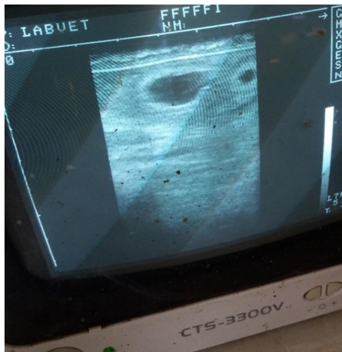
Figura 4 - Diagnóstico de gestação positiva pela presença de líquido nos cornos uterinos por ultrassonografia aos 36 dias pós inseminação artificial em tempo fixo (IATF).

Os diagnósticos de gestação eram realizados majoritariamente através de palpação retal, pois se buscava prenhez avançada, ou seja, acima de 60 dias, já que na maioria das vezes o serviço era prestado isoladamente ou com a intenção de separação de vacas gestantes das não gestantes. Assim sendo, as vacas gestantes ficavam a parte para parirem e as não gestantes eram então encaminhadas para a reprodução. Nos casos em que a IATF era feita previamente, o diagnóstico precoce, com auxílio do ultrassom, era realizado em torno de trinta dias após a inseminação, quando havia intenção de realizar uma ressincronização nas fêmeas que não estivessem prenhes, como mostra a Figura 4.