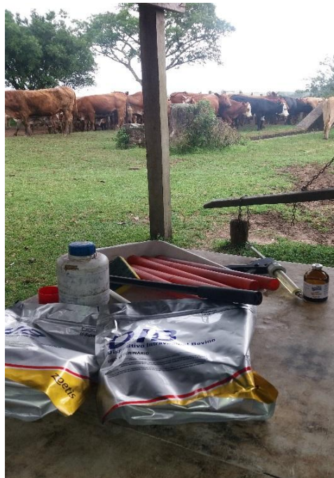
Figura 1 - Lote de novilhas no dia zero (D0) do protocolo hormonal de inseminação artificial em tempo fixo (IATF).

No caso de protocolos hormonais para vacas desmamadas e novilhas púberes, era utilizado no dia zero (D0, é quando se inicia o programa) 2 mg de benzoato de estradiol (GONADIOL®, Zoetis) e era aplicado dispositivo intravaginal com liberação lenta de progesterona (DIB®, Zoetis, 1g), conforme ilustrados na Figura 1.