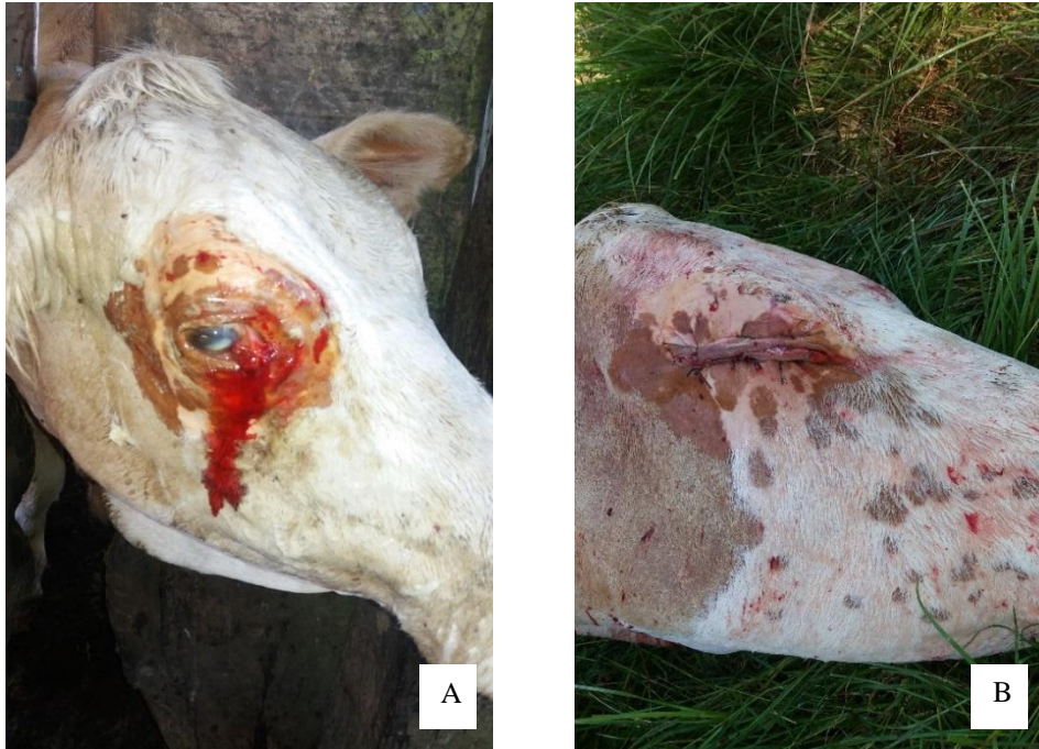
Figura 7 - Vaca no tronco de contenção após ter sido realizada tricotomia e anestesia infiltrativa (A) e sutura de pele em cirurgia de exenteração (B).