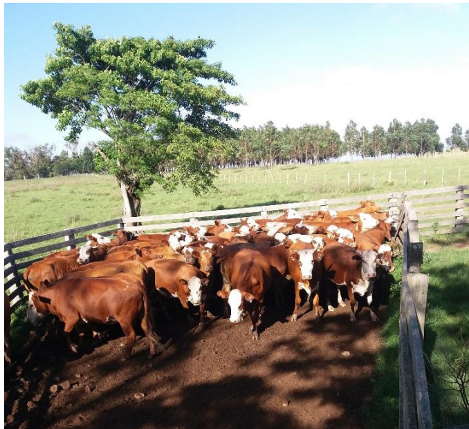
Figura 5 - Lote de novilhas padronizadas e selecionadas para inseminação artificial em tempo fixo (IATF).

Novilhas eram selecionadas a partir de seu fenótipo, estrutura física e peso mínimo (60% do peso adulto estimado). Quando eram avaliadas pelo seu fenótipo e estrutura física, as características buscadas eram pelame padrão, profundidade de tórax, espaço pélvico e largura da garupa, como ilustra a Figura 5. Nas raças sintéticas (Brangus e Braford), que foram as mais trabalhadas, o peso estimado geralmente era entre 280-300kg.