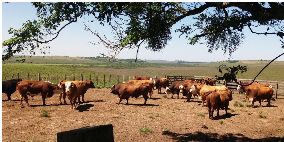
Figura 6 - Touros aguardando para serem submetidos ao exame andrológico.