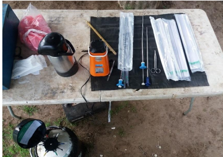
Figura 2 - Botijão de sêmen, descongelador, termômetro, aplicadores de sêmen e bainhas.

O protocolo hormonal usado em vacas com terneiro ao pé com mais de 60 dias de paridas e que estivessem ciclando é basicamente o mesmo utilizado para as vacas desmamadas e novilhas, modificando apenas a dosagem de gonadotrofina coriônica equina (NOVORMON®, Zoetis), que foi aumentada para 300 UI. Os dias de aplicação dos diferentes hormônios (0, 7, 9 e 11) continuavam os mesmos. (Figura 3)