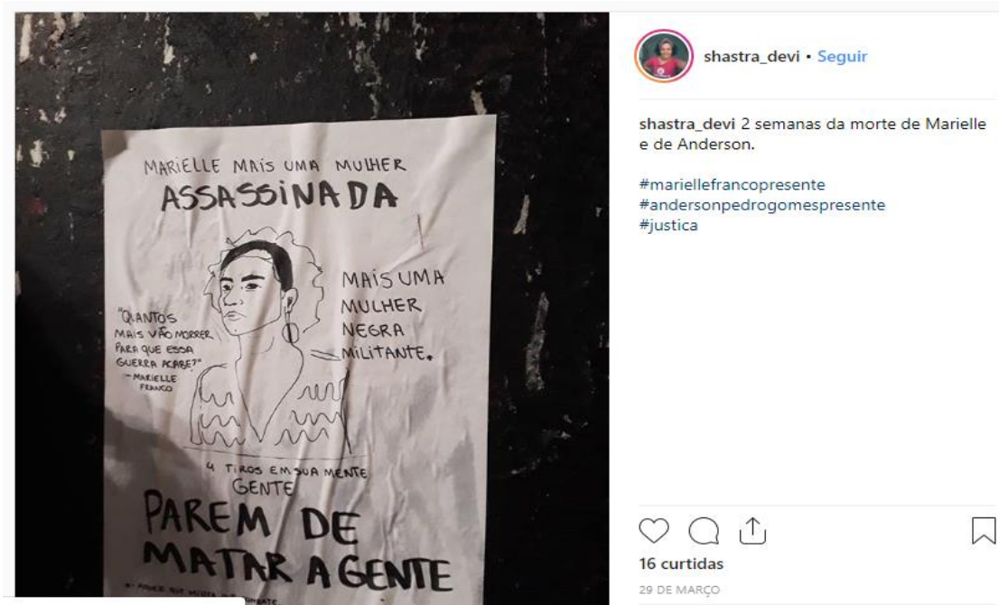
Figura 1 - Modelo de postagem da rede social Instagram