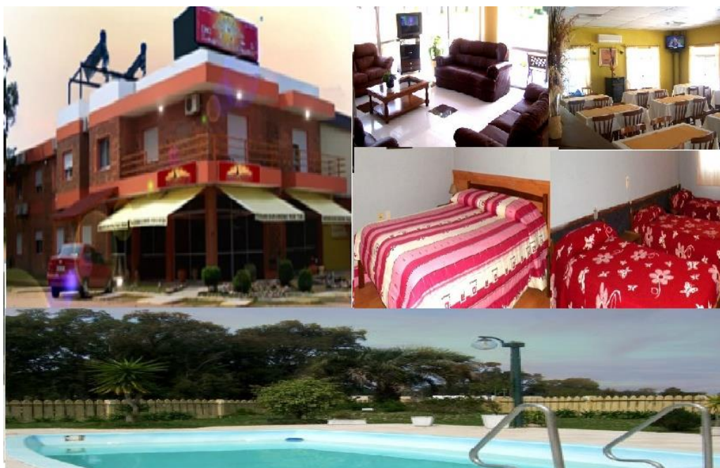
Figura 3: Hotel Laguna Merín

Cuenta con una serie de servicios entre ellos: 3 piscinas abiertas y una cerrada climatizada. Dentro de sus instalaciones cuenta con un restaurante abierto, sauna, sala para eventos y reuniones, sala de ejercicios, barbacoa, cyber café, generador de energía eléctrica 2 , conforme la Figura 3.