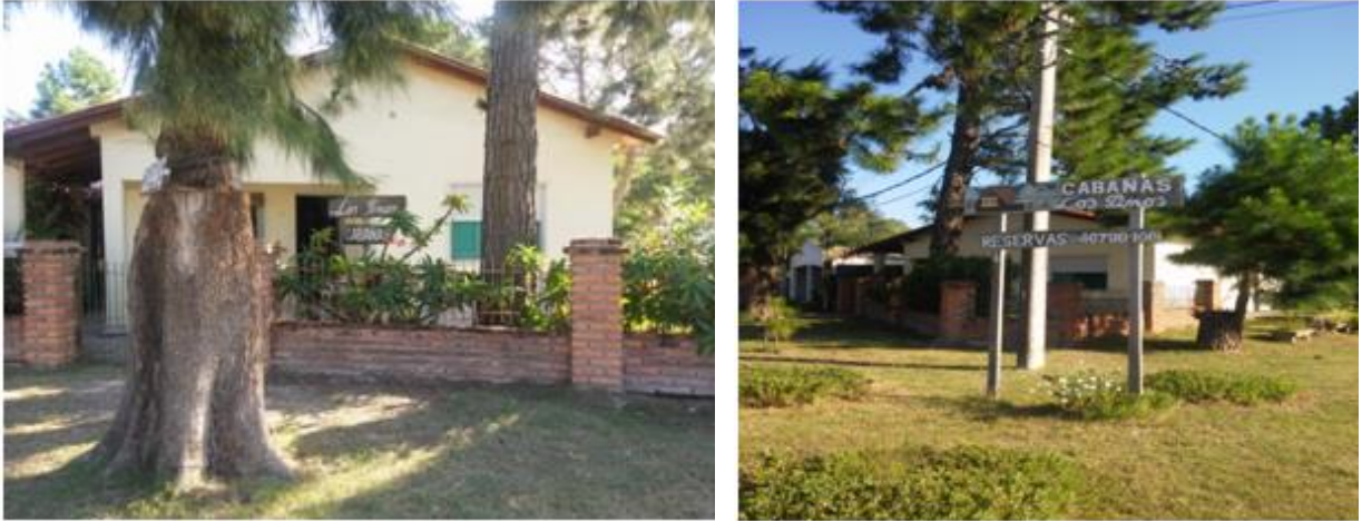
Figura 7: Cabañas los Pinos (2017).

Como otro alojamiento: Hostelería Alcalá del Lago se encuentra a 50 metros de la playa, cuenta con 9 habitaciones, dormitorios como baño privado, tv, ventiladores, wifi, restaurante con menús de la casa. Como muestra la Figura 8.