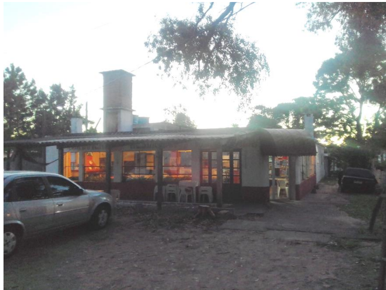
Figura 8: Hostelería Alcalá del Lago.

Como otro alojamiento: Hostelería Alcalá del Lago se encuentra a 50 metros de la playa, cuenta con 9 habitaciones, dormitorios como baño privado, tv, ventiladores, wifi, restaurante con menús de la casa. Como muestra la Figura 8.