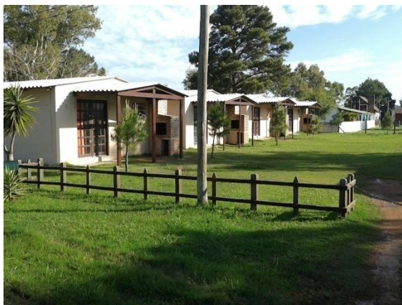
Figura 5: Complejo Cabañas Rodrigues Fuente Portal del Lago Merín (2016).

Cabañas Rincón del Lago son 10 en total, de las cuales son 4 cabañas y 6 apartamentos, equipadas con camas, cocina, salón, ventiladores o aire acondicionado dentro de cada habitación, como muestra la Figura 6 7