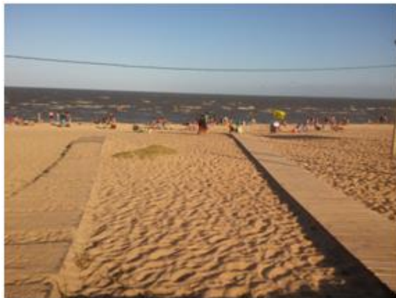
Figura 9: Rampas en la playa

El balneario cuenta con rampas que fueron construidas en 2013, que facilitan el acceso a la playa a las personas, y principalmente a aquellas con algún tipo de discapacidad física como se puede ver en la Figura 9.