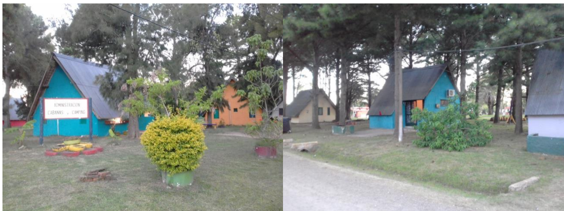
Figura 4: Cabañas Municipales.

El camping municipal ofrece piletas para la ropa y tanques de lavavajillas, así como también es una zona de mucha arboledas, no existen parcelas para acampar, el lugar lo elige el turista, los precios son diferenciados para carpas o casas rodantes, existen diferentes precios para temporada alta (comprendida entre el 1° de Noviembre y el 31 de mayo) y baja temporada (comprendida entre 1° de Junio y el 31 de octubre) no se encontró en los diferentes sitios web precios actualizados 4 . Camping y bungalows AEBU (Asociación de Bancarios del Uruguay) localizado en calles 19 y 20 cuenta con luz, piletas para ropa, lava vajilla, juegos para niños, 2 piscinas abiertas, salón de 40 mts 2 con cantina, tv, video, parrillero 5 .