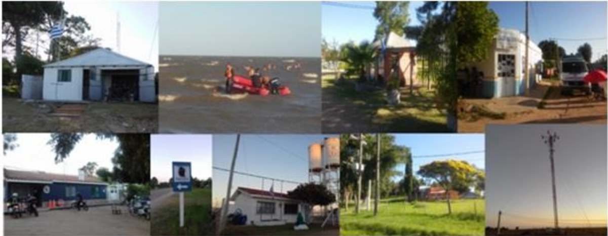
Figura 12: Prefectura Naval, Centro de información turística, Policlínica Lago Merín, Policía Nacional, OSE, Escuela N° 91, antena de telecomunicaciones