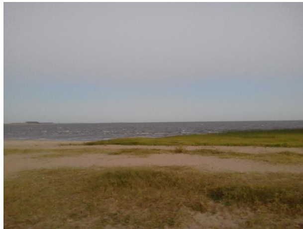
Figura 10: Laguna Merín

Por eso es considerada como una de las principales reservas ecológica, lo que la hace ser un atractivo natural (ACHKAR, DOMINGUEZ y PESCE, 2012). Como muestra la Figura 10.