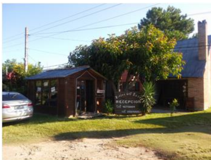
Figura 6: Cabañas Rincón del Lago Fuente: Autoría propia (2017).

Cabañas Rincón del Lago son 10 en total, de las cuales son 4 cabañas y 6 apartamentos, equipadas con camas, cocina, salón, ventiladores o aire acondicionado dentro de cada habitación, como muestra la Figura 6 7