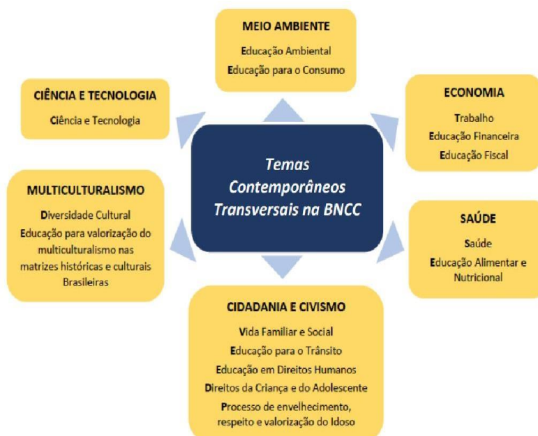
Figura 4 - Temas Contemporâneos Transversais na BNCC

Conforme o documento Temas Contemporâneos Transversais (TCT) na BNCC - Contexto Histórico e Pressupostos Pedagógicos, os temas objetivam contextualizar os conteúdos aprendidos, oportunizando a elaboração de relações de temas que sejam de interesse dos estudantes e de relevância para seu desenvolvimento como cidadão. Assim, espera-se que os TCT oportunizem a compreensão de temas relativos a: quais são seus direitos e deveres enquanto cidadãos; aceitar, compreender e respeitar que todos os seres humanos são diferentes; como cuidar de sua saúde, como usar as novas tecnologias digitais, como cuidar do planeta em que vive, como utilizar seu dinheiro, assuntos que conferem aos TCT o atributo da contemporaneidade. A Figura 4 a seguir apresenta a proposta dos TCT.